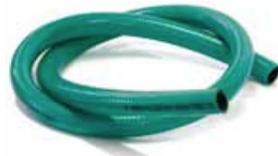
Tubo di peso inferiore di circa 2/3 ai convenzionali tubi di PVC e gomma. Flessibilità molto elevata ad angolo di curvatura molto ridotto che impedisce la strozzatura del tubo. Adatto al montaggio su avvolgitubo automatico.