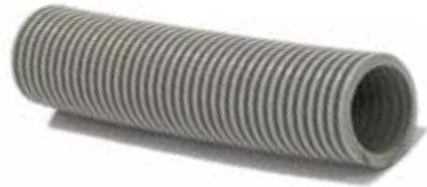
Tubo aspirapolvere leggero. Temperatura: -30°C +60°C.