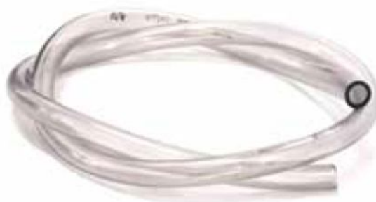
Monostruso in PVC, ottima trasparenza e alta flessibilità.