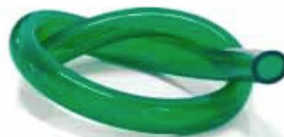
Monostruso in PVC plastificata di 1ª qualità idoneo nel giardinaggio ed agricoltura.