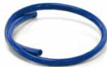
Tubo flessibile retinato in poliuretano per utensileria in genere, verniciatura, aerografi, soffiaggio. Temperatura: -20°C +60°C.