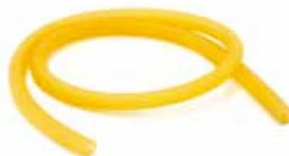
Tubo in lattice naturale per uso farmaceutico e ospedaliero.