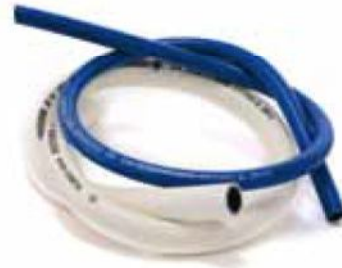
Tubo flessibile in formulazione speciale di gomma termoplastica con maglia di rinforzo in fibra poliestere ad alta tenacità. In PVC per mandata GPL e Metano per uso domestico.